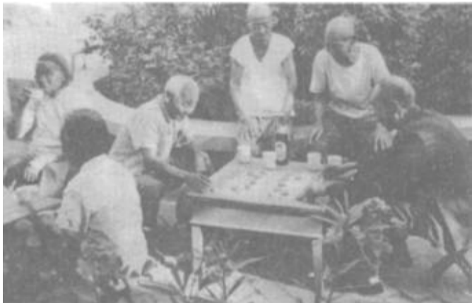
广饶县大营乡不断改善敬老院的生活和服务设施，努力把敬老院真正办成老人的幸福乐园，被评为省先进敬老院。

“枪打出头鸟”，是警告人们不要冒尖，不要出头，要人们随“大流”。不知此言源于何时，但至今还束缚着人们的思想，有些人唯恐做了“出头鸟”挨“枪子”，倒大霉。其结果造成领导不敢决断，使企业贻误了良好的经营时机；职工不敢创新，导致企业举步维艰。在扩大改革开放的今天，可见“枪打出头鸟”此言其害深矣！