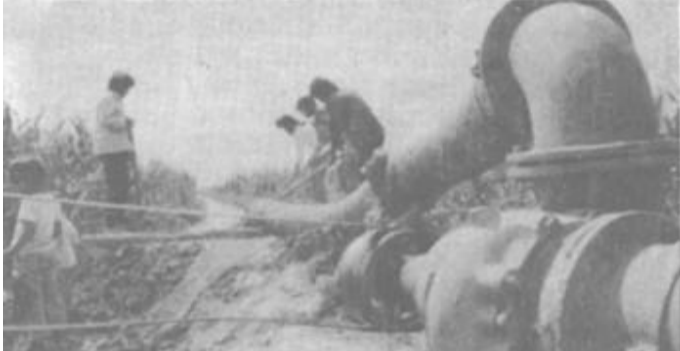
河口区义和镇迅速掀起“三秋”生产热潮，边收边灌，目前全镇已浇灌耕地5000亩。图为该镇蒲台村农民在浇地。