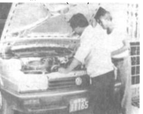
办事处汽车修理厂生意兴隆

近几年来，随着黄河三角洲的开发建设，各地经商者纷至沓来。大量外地人口的不间断涌入，给当地人口管理和计划生育工作带来了很大难度。为严格执行计划生育这一基本国策，这个办事处把对流动人口的管理纳入日常工作。他们采取了三条措施：一是与各采油厂、开发局搞好协作，签订共同管理责任书，将流动人口管理纳入各单位管理目标。二是与驻地各大医院搞好协调，规定凡到该院检查、接生者必须持该计生办出具的证明信。三是与公安、工商、税务等部门搞好协调，商、税务等部门搞好协调，的避风港。