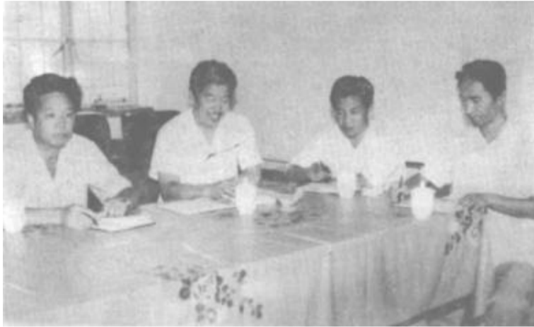
图为办事处领导班子在研究工作。

在改革开放的新形势下，孤岛办事处党委更加注重基础设施建设，这里公路成网，交通方便；邮电通讯业发达，电话已实现国内直拨；城区建设正在向花园城市发展。特别是东营黄河海港的建成通航，将加速这一地区的经济繁荣和振兴。我们相信，不远的将来，这里一定会建成集石油、港口、畜牧、水产加工等为一体的新兴城镇，我们热烈欢迎中外客商，有识之士来孤岛观光旅游，兴办企业，共同来开发建设这块宝地，为建设美丽富饶的黄河三角洲作出自己的贡献。